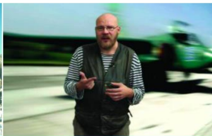
Ruská propaganda v Česku