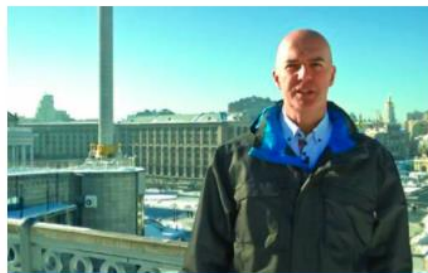
Nic než lži