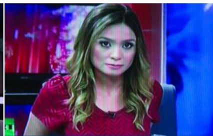
2015: Svět podle Russia Today