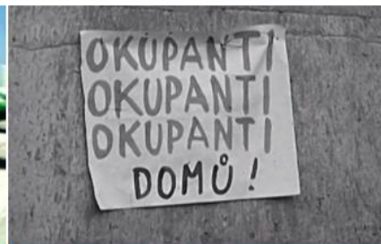
U nás pomáhali taky