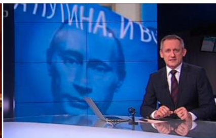
2015: Rusko-ukrajinská informačn...