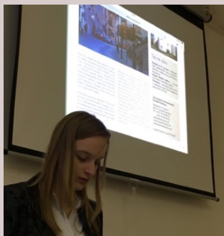
Obr.6 Prezentácia úloh

Aktivity prezentované v tomto metodickom liste na tému Prítomnosť UNESCO vo vzdelávaní sme pilotne otestovali na gymnáziu pri vyučovaní skupinovou formou. Na konci hodiny bol krátky priestor na reflexiu a vyjadrenie názoru. Niektoré názory publikujeme pre posilnenie spätnej väzby.