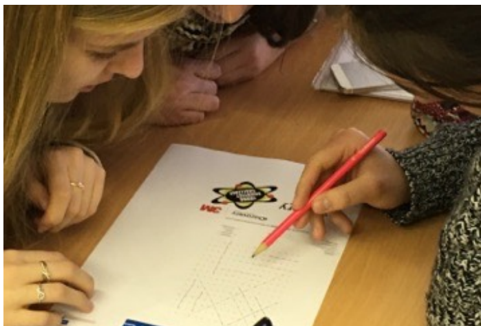
Obr.2: Práca na úlohách

Po tejto úvodnej časti učiteľ prezentuje teoretický základ preberanej problematiky spôsobom, ktorý uzná za vhodný aj podľa toho akú zložku žiakov má k dispozícii.