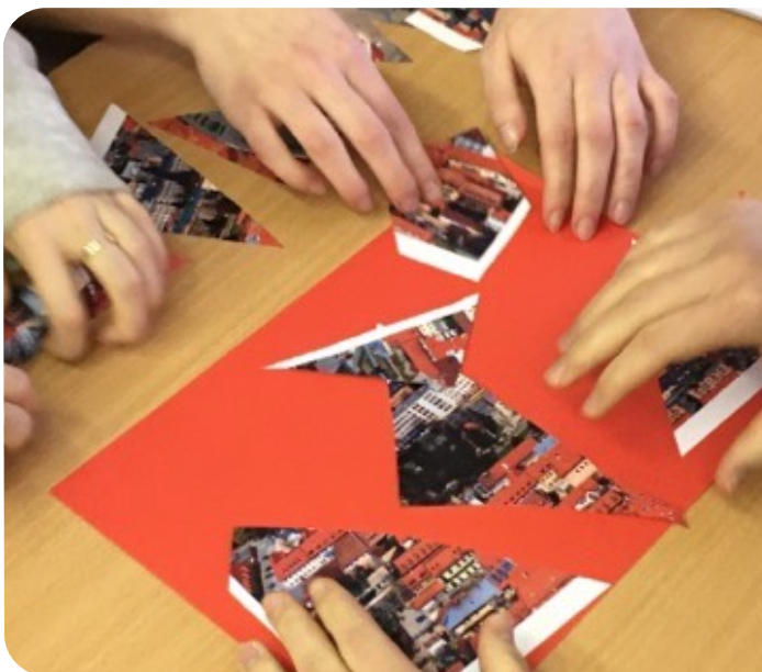
Obr.3: Práca na úlohách

Metodika: Cieľom tejto úlohy je rozvíjať vyznať sa v spleti informácií v anglickom jazyku a rozvíjaním prezentačných zručností ich transformovať a prezentovať skupine. Rozvíjajú sa komunikačné zručnosti, práca s anglickým textom, schopnosť triediť informácie.