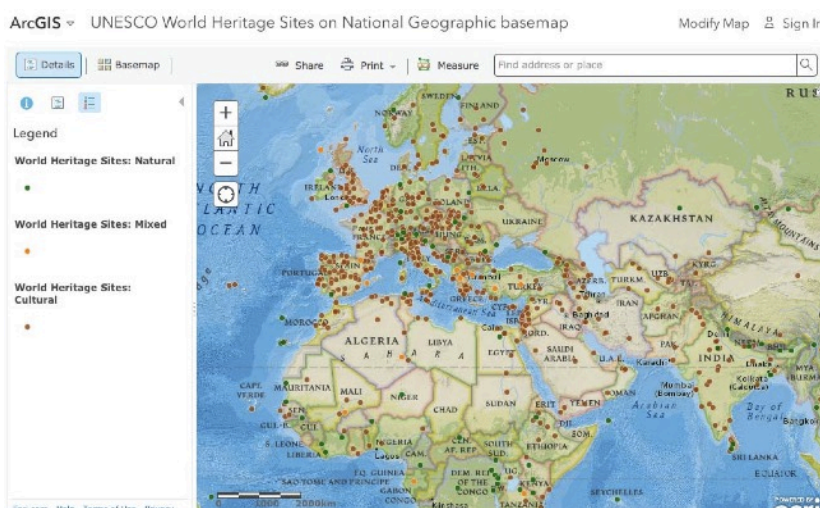
Obr. 4: Printscreen obrazovky s online mapou

Pomôcky: počítač, tablet, dataprojektor, pauzovací papier, technické perá alebo fixy