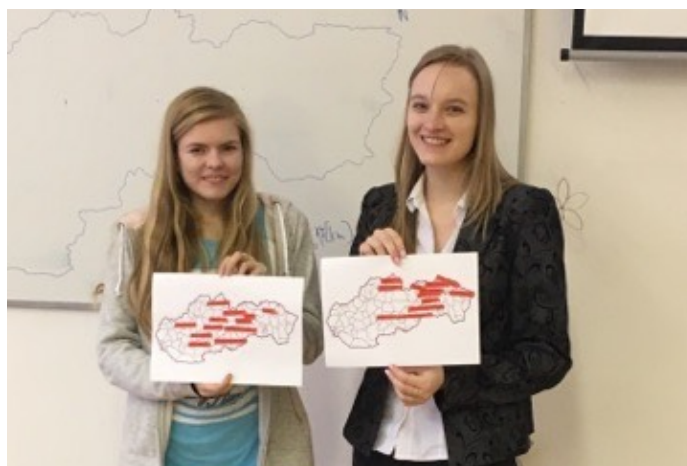
Obr. 5 Prezentácia aktivity. Zdroj: Archív autora

mať vytvorené (môžu aj žiaci) logo témy/celku a slogan. Takto sme vytvorili slogan Education needs complete solution a logo prezentované v dolnej časti na str. 1.