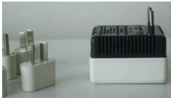
Transformátor k cestovnej súprave zástrčiek

Určite budú prekvapení – a môžu rozmýšľať nad dôvodmi – že táto súprava vyrobená v USA neobsahuje zástrčky pre Blízky Východ, Rusko a zvyšok Ázie. Ešte viac budú prekvapení, ak zistia, že v niektorých krajinách (dokonca v USA) sa v domácom elektrickom vedení používa napätie 110 V, takže cestovateľ z USA potrebuje v Európe špeciálny transformátor, aby mu európska sieť (220 V) nespálila jeho elektrické spotrebiče. Z toho naopak vyplýva problém, že niektoré naše elektrické spotrebiče nebudú cestovateľovi v USA fungovať.