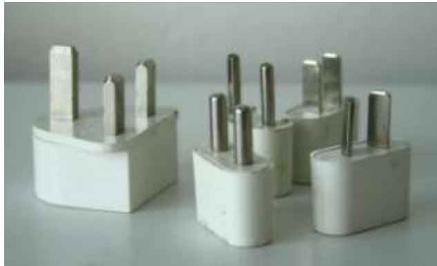
Cestovná súprava zástrčiek pre krajiny celého sveta

Mnohí žiaci nižšieho sekundárneho vzdelávania síce už s rodičmi cestujú do zahraničia, nie sú to však všetci. Niektorí necestujú ďaleko, ďalší si mnohokrát neuvedomujú všetky súvislosti cestovania. Pre väčšinu z nich bude určite prekvapením, že aj taká obyčajná a každodenná vec, ako sú elektrické zásuvky a zástrčky, môže mať v rôznych krajinách rôzne podoby.