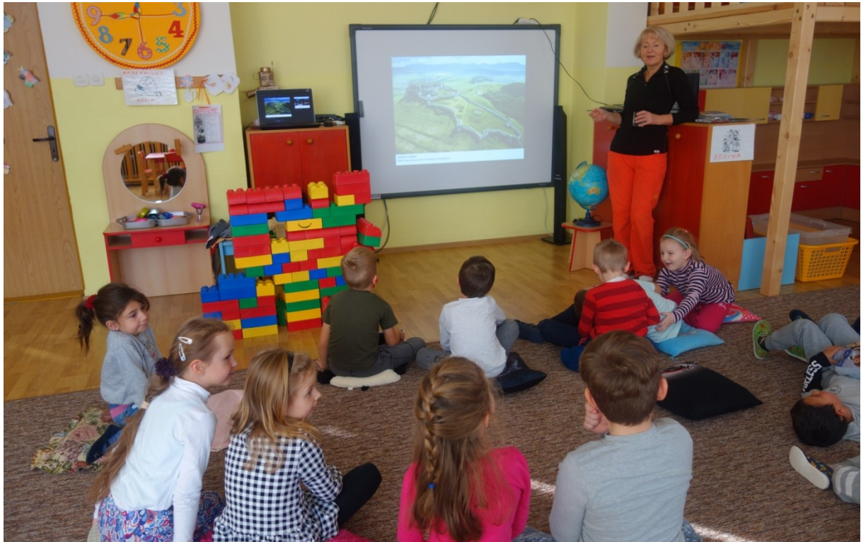
Obr. 9 Ukážka prírodného a kultúrneho dedičstva UNESCO na Slovensku – Spišský hrad

Deťom sa páčil najmä Spišský hrad. Dohodli sa, že začiatkom leta naplánujú školský výlet na Spišský hrad.