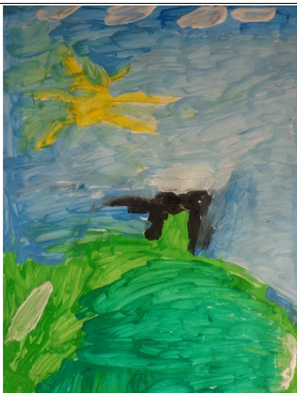
Obr. 16 Mal'ba vrchu Orlová I. 4