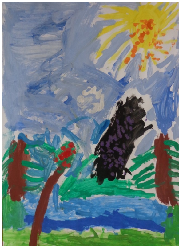
Obr. 17 Mal'ba vrchu Orlová II. 4