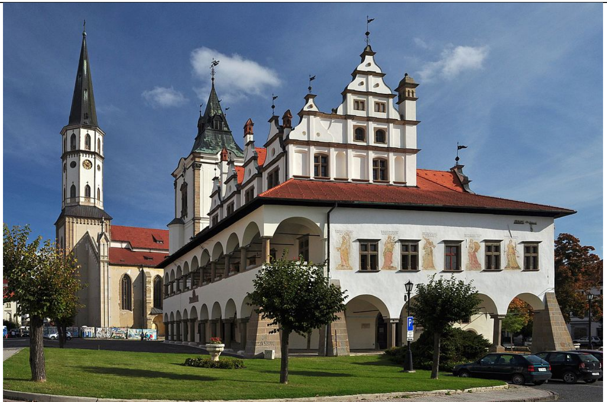
Obr. 3 Levoča