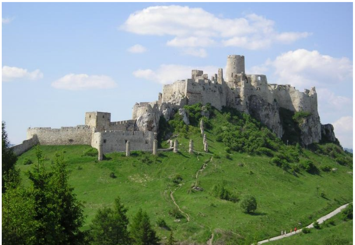
Obr. 4 Spišský hrad