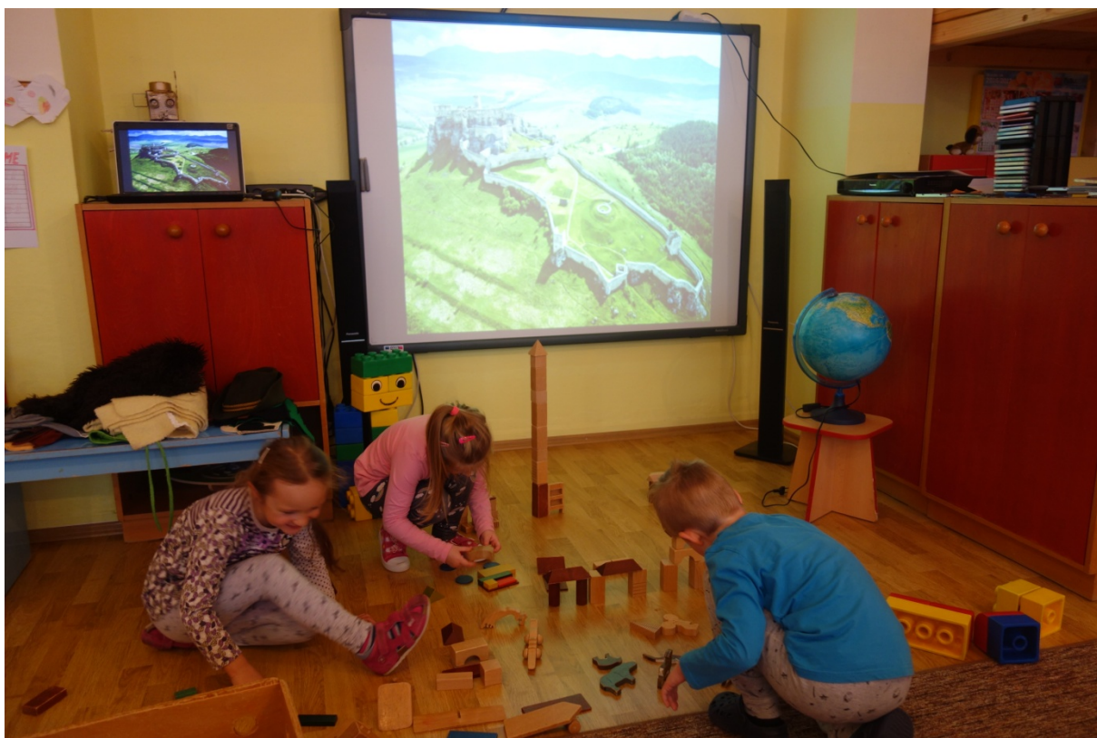
Obr. 15 Stavanie Spišského hradu zo stavebníc podľa fotografie