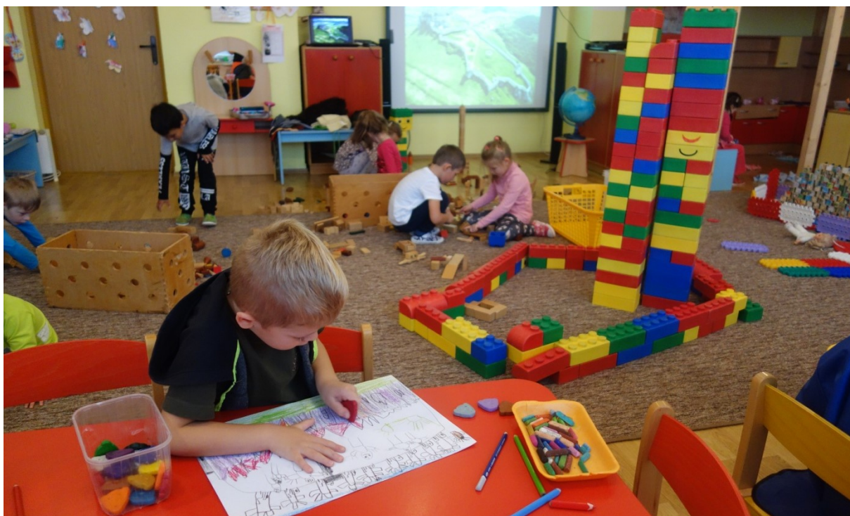
Obr. 14 Individuálna a skupinová práca detí

Nasledovala individuálna a skupinová práca detí. Mohli kresliť, maľovať alebo vytvárať zo stavebníc prírodné a kultúrne pamiatky, či už tie, ktoré sú v zozname UNESCO, napr. Spišský hrad (obr. 14, 15), alebo tie, ktoré žiadali zapísať do zoznamu vo svojom liste, napr. vrch Orlová (obr. 16, 17, 18).