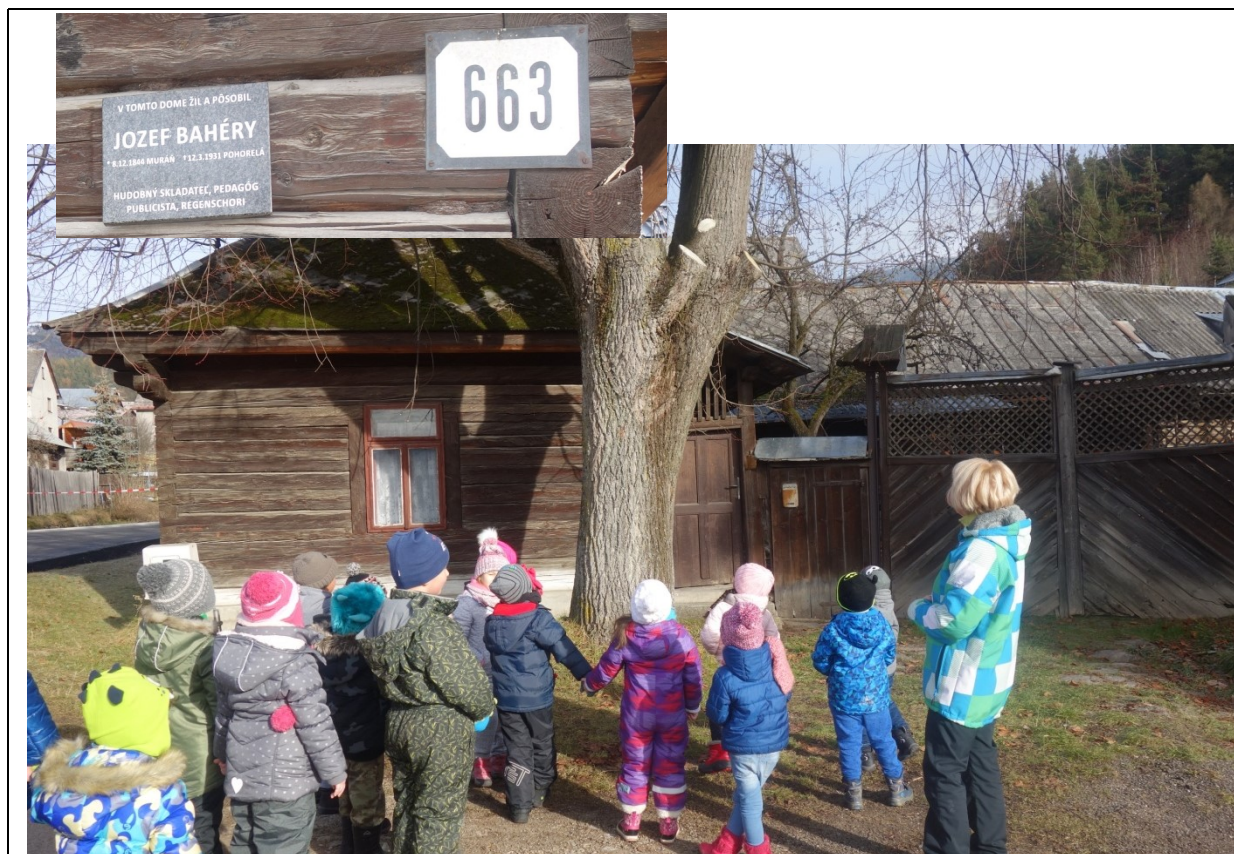
Obr. 12 Turistická vychádzka za zaujímavosťami Pohorelej – dom Jozefa Bahéryho

Učiteľka podnecovala deti k uvažovaniu, ako to, že kostol, hoci bol postavený skôr ako fara, vyzerá zachovalo, a fara je schátralá.