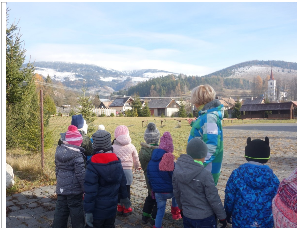
Obr. 11 Turistická vychádzka za zaujímavosťami Pohorelej – vrch Orlová

Ďalej deti počas vychádzky ukazovali na rôzne zaujímavosti, učiteľka ich podnecovala, aby pri každom návrhu sa pokúsili aj zdôvodniť, prečo by daná vec alebo lokalita mala byť na zozname. Deti, napr. navrhovali starobylé domy alebo brány, pretože boli „starodávne“.