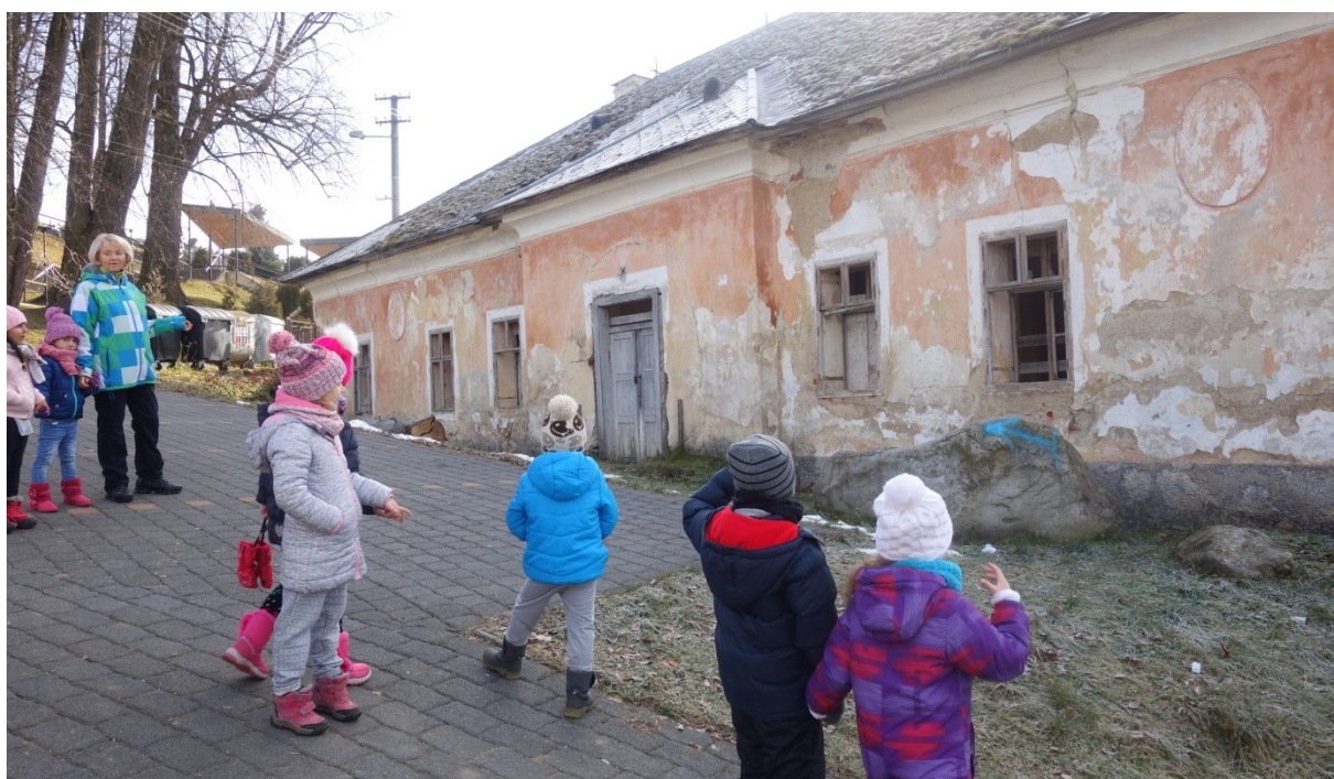
Obr. 13 Turistická vychádzka za zaujímavosťami Pohorelej – stará fara