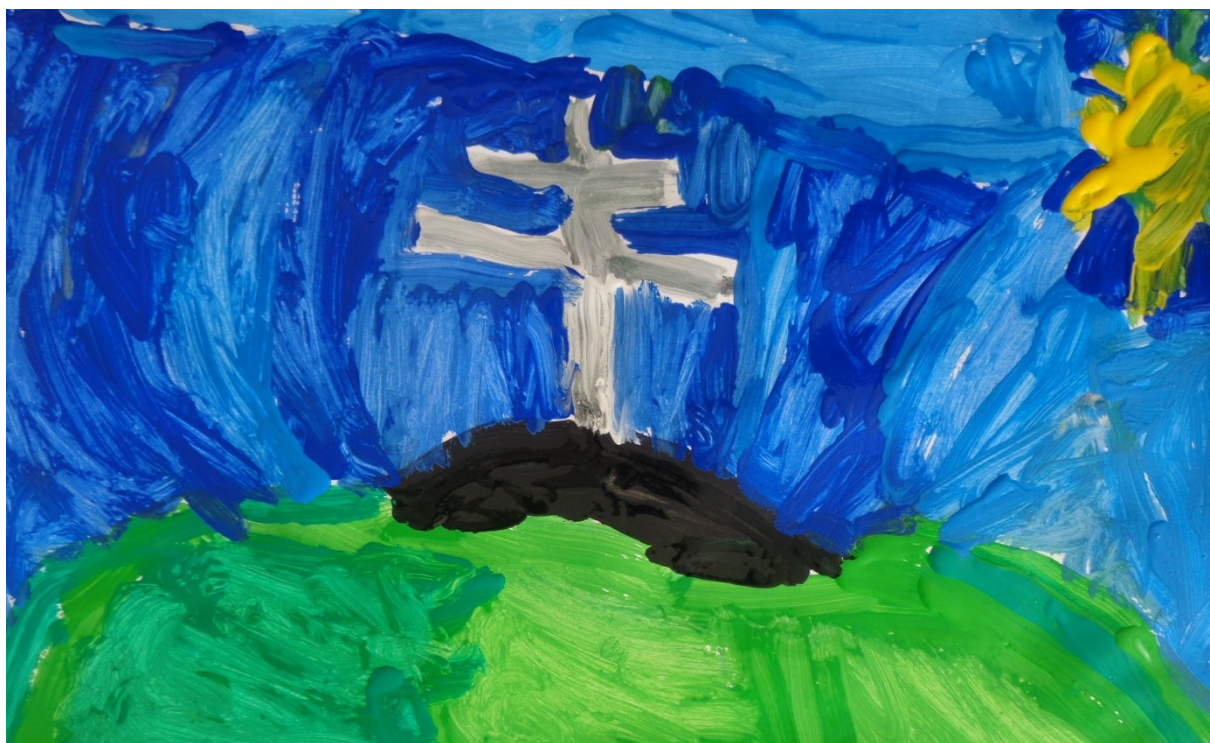
Obr. 18 Mal'ba vrchu Orlová III. 4