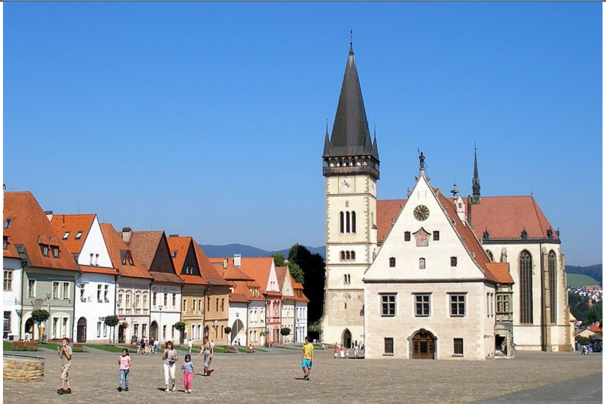
Obr. 1 Bardejov