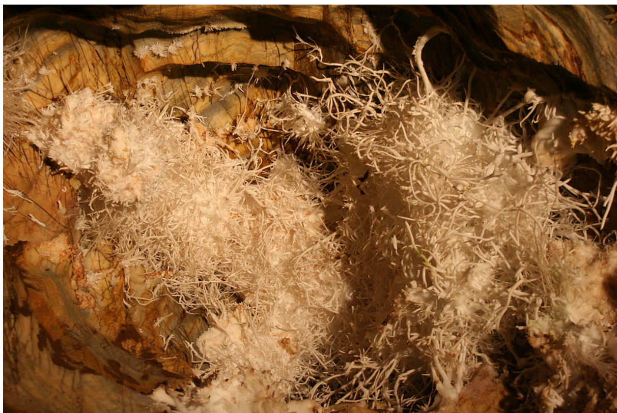
Obr. 6 Ochtinská aragonitová jaskyňa