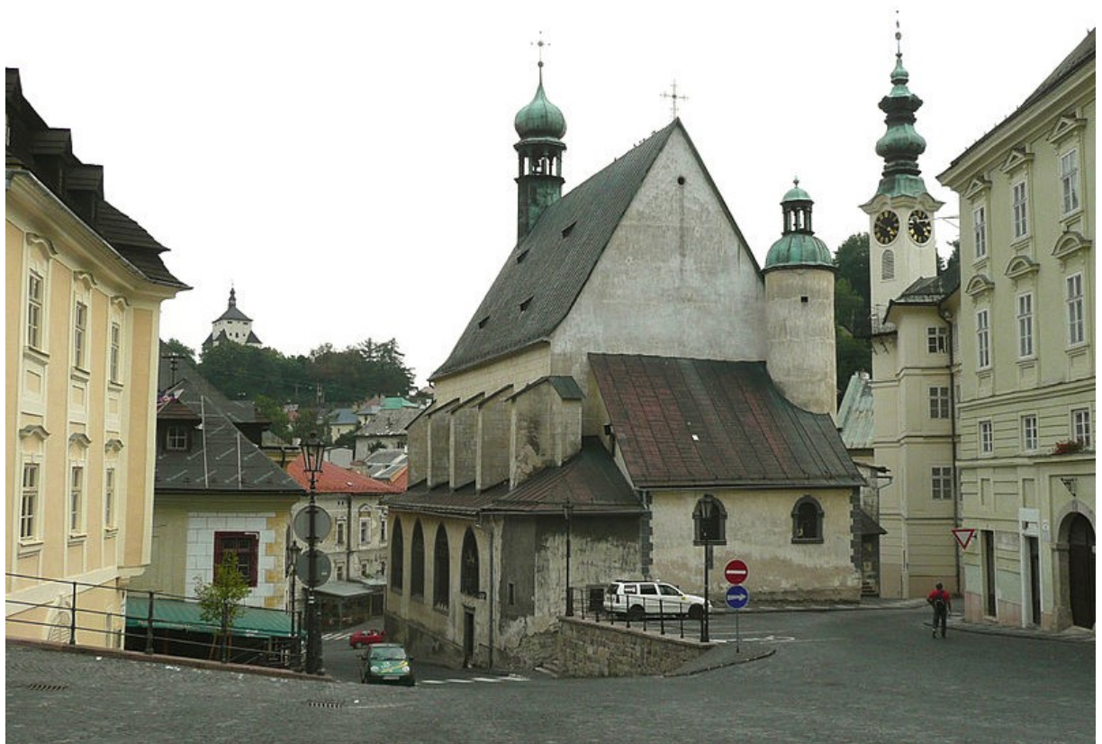
Obr. 2 Banská Štiavnica