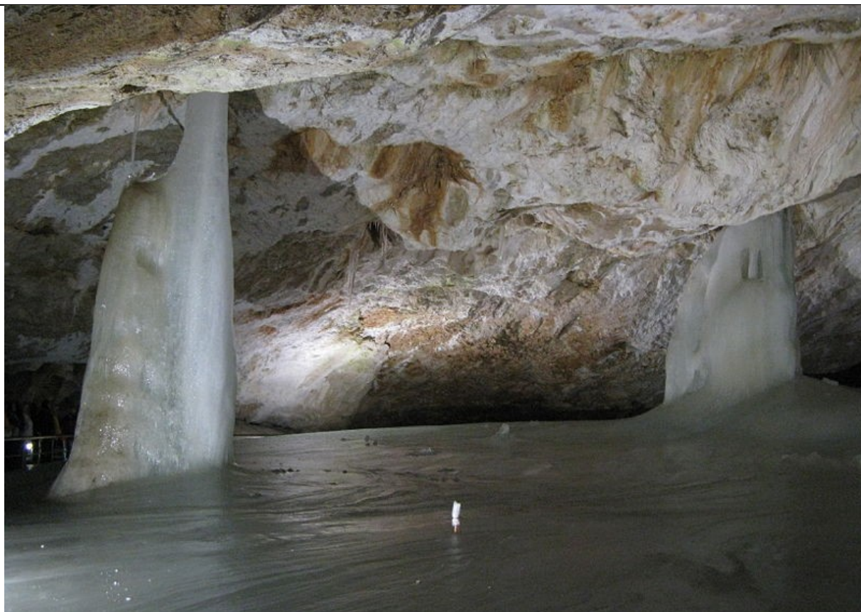
Obr. 5 Dobšinská ľadová jaskyňa