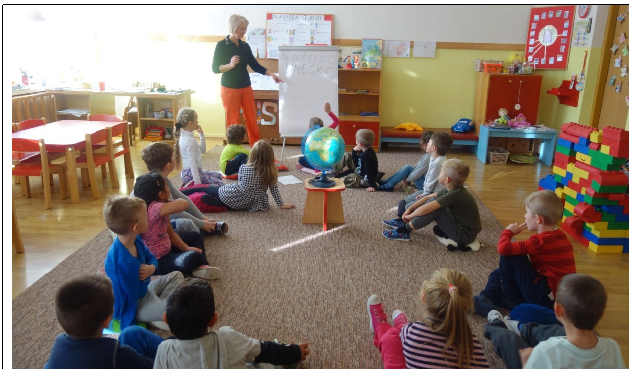
Obr. 8 Rozhovor v komunikatívnom kruhu, vysvetlenie neznámych pojmov

Učiteľka pokračovala v diskusii s deťmi. Na flipchart napísala ďalšie neznáme slovo – UNESCO (foneticky UNESKO). Deti ho prečítali.