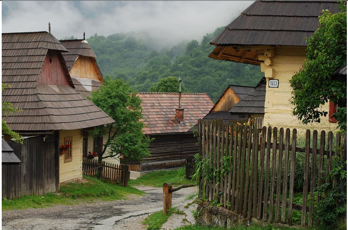
Obr. 7 Vlkolínec