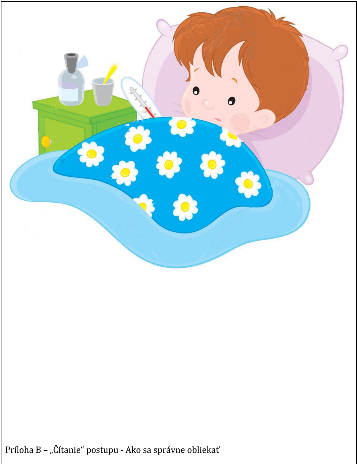
Príloha B – „Čítanie“ postupu - Ako sa správne obliekať