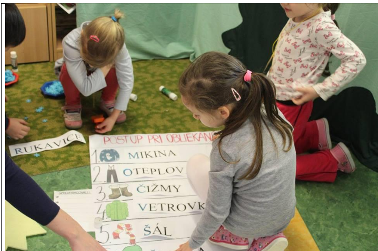
Príloha D – Obojsmerná podložka pod Bee bot: programovanie včielky na základe obrázka na hracej kocke, vyslovenie názvu oblečenia na obrázku, sluchová identifikácia prvej hlásky vysloveného slova