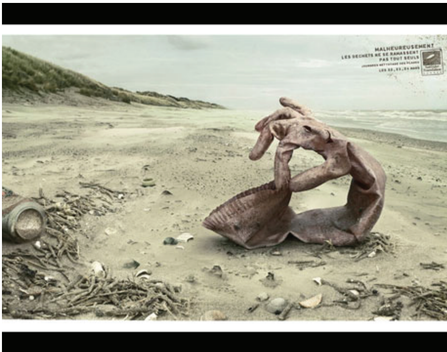
http://pop.h-cdn.co/assets/cm/15/05/54c7ee2043792 - the-glove-lg.jpg